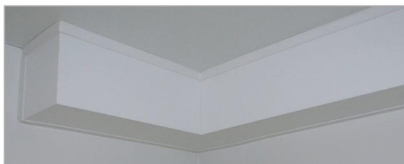
het eindresultaat: een nette, afgewerkte leidingkoker