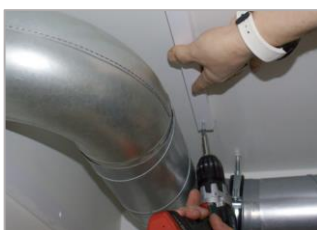
montageprofiel afkorten en op de wand en het plafond monteren