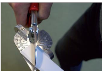
afwerkprofiel op lengte knippen, zagen of snijden