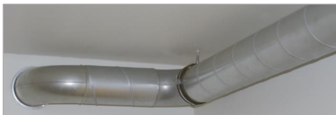
af te werken ventilatiekanaal