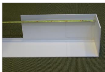
opmeten benodigde lengte