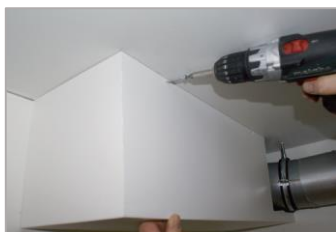
paneel monteren, bij het F-profiel is vastschroeven niet nodig!