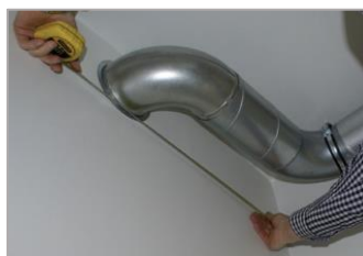
opmeten lengte van het paneel, aftekenen en afsnijden paneel op benodigde lengte