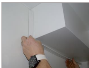
afwerkstrip op het paneel plakken, rubberrand tegen de muur/het plafond