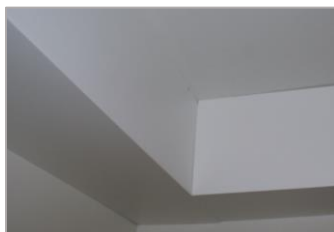
2e deel van het paneel monteren conform deel 1