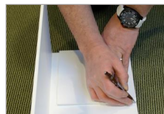
sparing zijkant (verticaal) aftekenen gemeten vanaf boven- en zijkant en uitsnijden